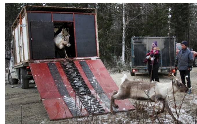
Här släpper Jovnevaerie sameby ut sina renar på vinterbete i skogarna utanför Bräcke.