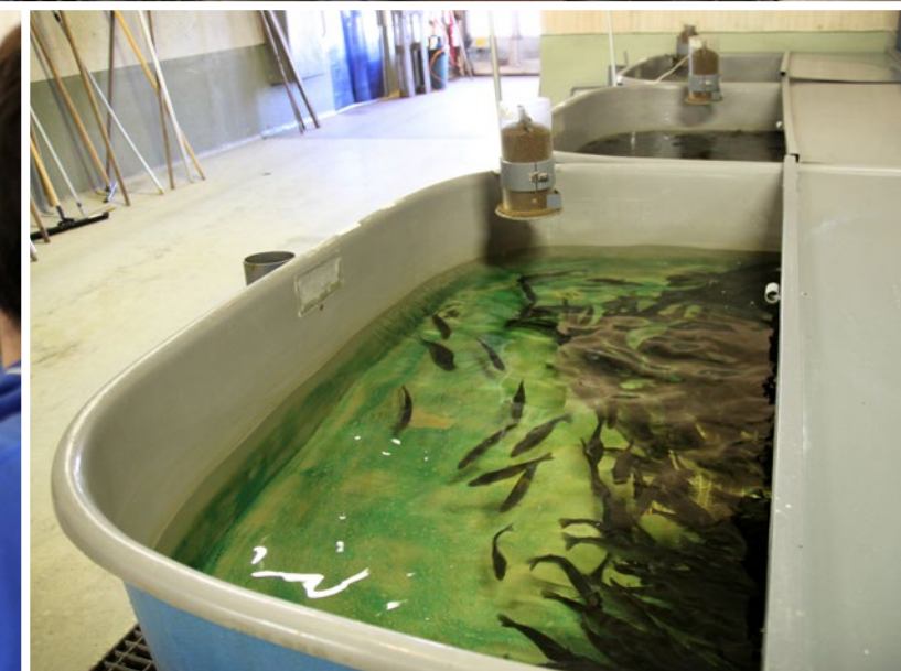
VBCN har avelsstammar som de håller "rena" från inavel och korsningar. Dessa blir föräldrar till fiskar som i sin tur kan sättas ut i det vilda. Den öring som VBCN säljer som sättfisk har sitt ursprung i Stavre-Gimån systemet.